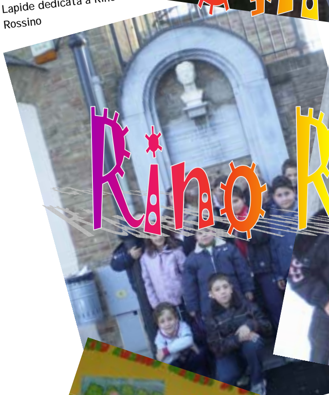
Lapide dedicata a Rino Rossino